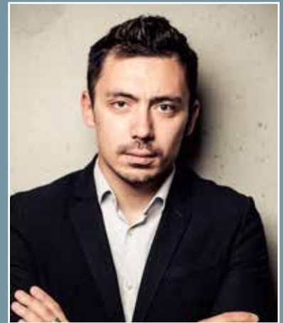
Александр Иванов «Поток»